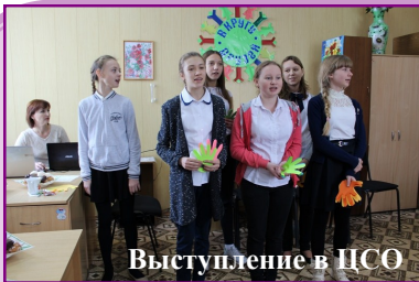
Выступление в ЦСО