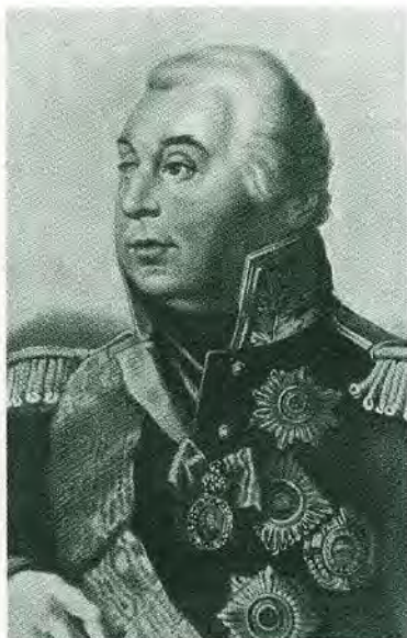
Князь Михаил Илларионович Кутузов-Смоленский.