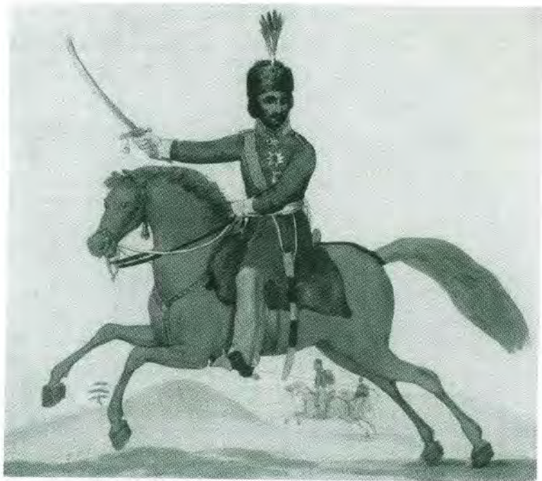
Атаман Платов. Английская раскрашенная гравюра начала XIX в.

Александр I представляет Наполеону калмыков, казаков и башкир. 9 июля 1807 года. П. Н. Бержере.