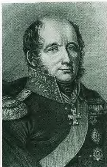
Михаил Богданович Барклай де Толли.