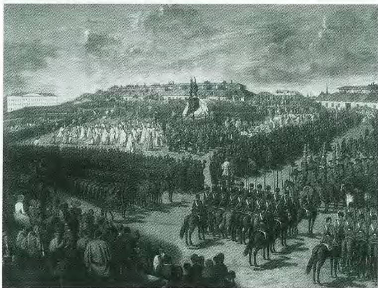
Открытие памятника М. И. Платову в Новочеркасске. 1853 год. Картина Майера. XIX в.