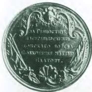
Копия именной медали: «За ревностную и усердную службу Донского войска Полковнику Матвею Платову». 1770-е гг.