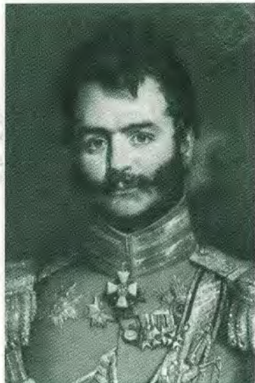
Василий Васильевич Орлов-Денисов.