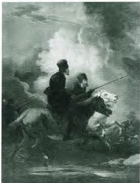
Донские казаки. А. О. Орловский. 1820-е гг.