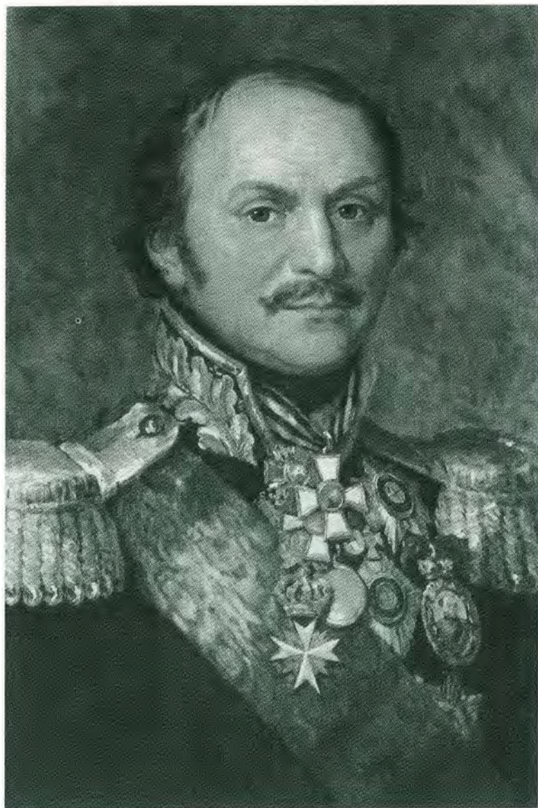
Граф Матвей Иванович Платов. Д. Доу. 1820-е гг.