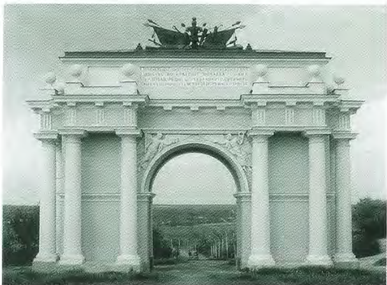
Триумфальная арка в Новочеркасске.