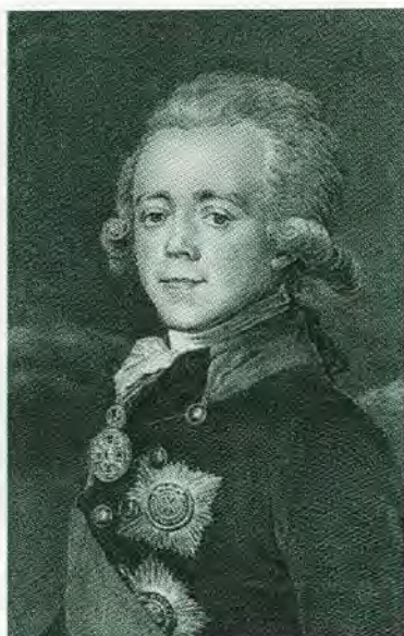
Император Павел I.