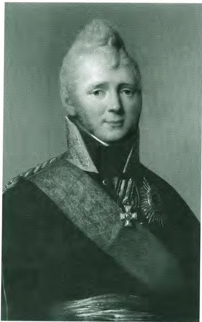
Император Александр I.