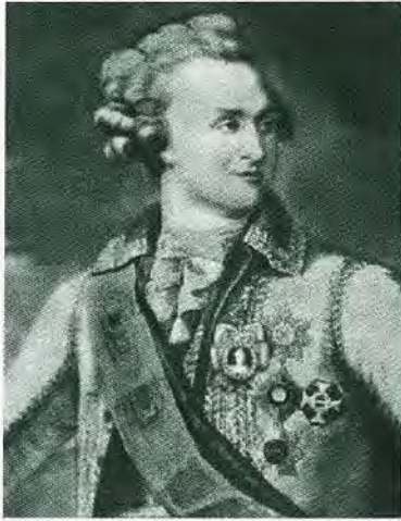
Князь Григорий Александрович Потемкин-Таврический.