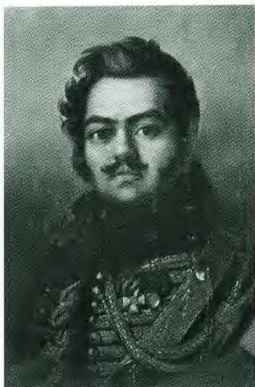
Денис Васильевич Давыдов.