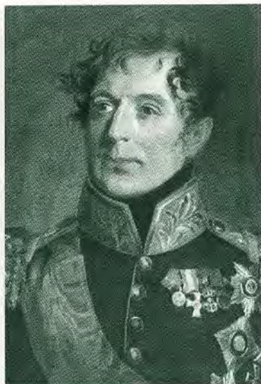
Граф Михаил Андреевич Милорадович.

Переправа через Березину 28 ноября 1812 года. Х. В. Фабер дю Фор. 1830-е гг.