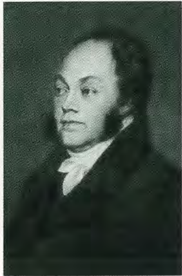
Граф Федор Васильевич Ростопчин.