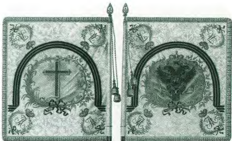
Знамя Войска Донского. 1811 г.