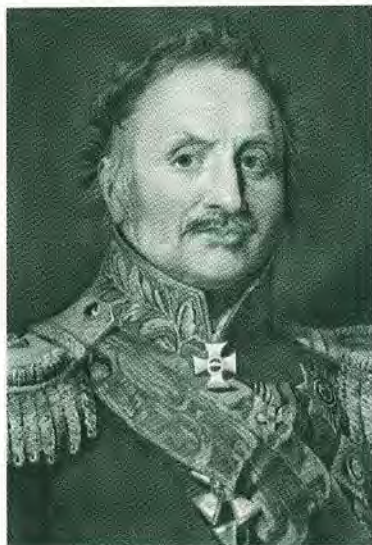
Граф Петр Христианович Витгенштейн.