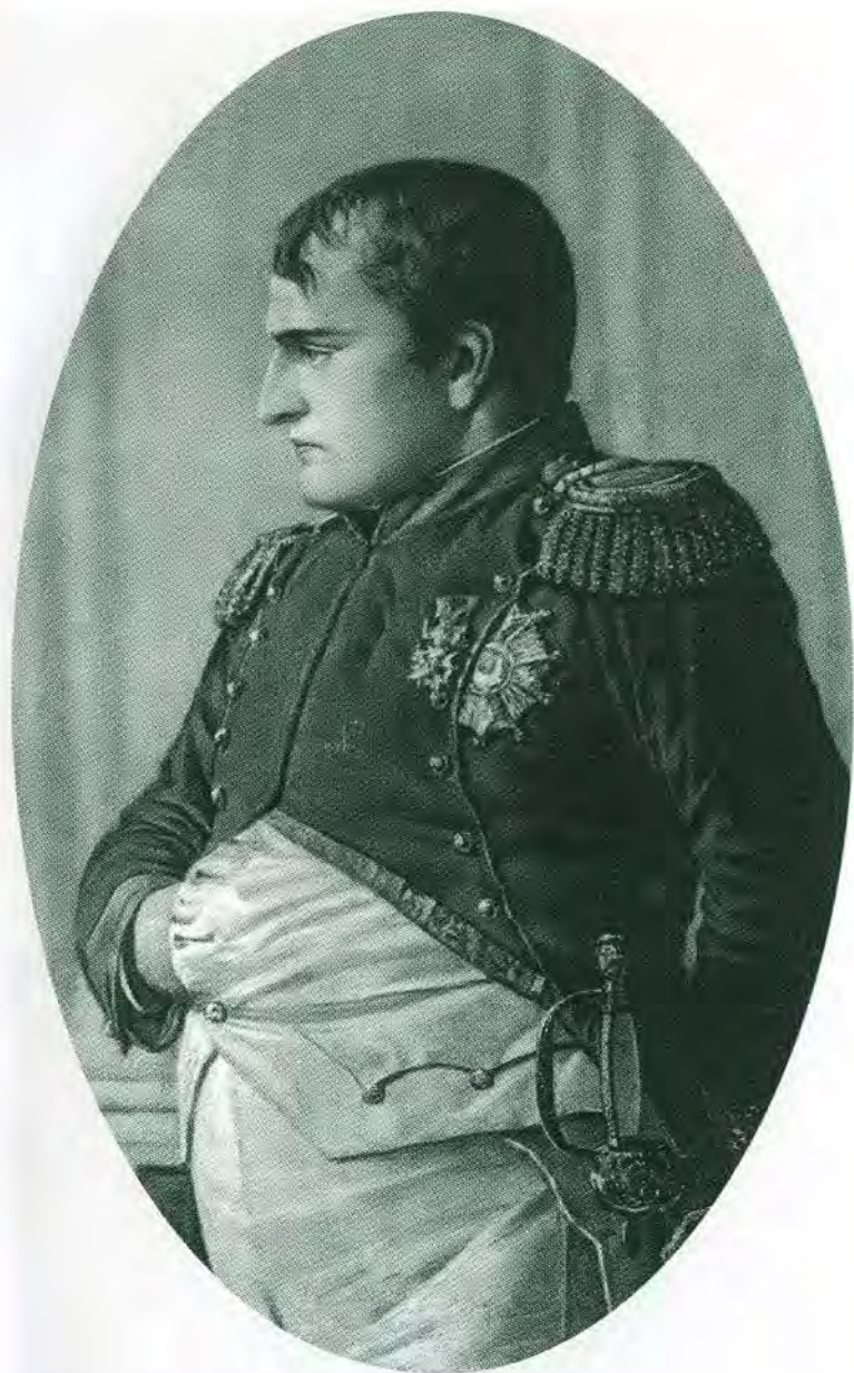
Наполеон. С портрета В. В. Верещагина.