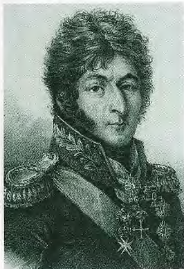
Князь Петр Иванович Багратион.