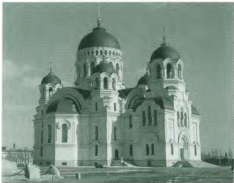
Войсковой Вознесенский собор в Новочеркасске.