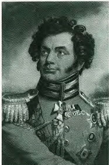
Федор Петрович Уваров.