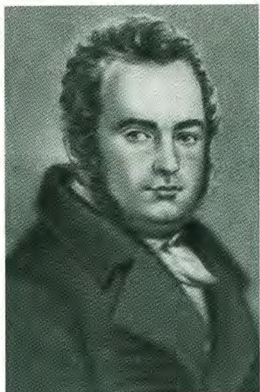
Сергей Николаевич Глинка.