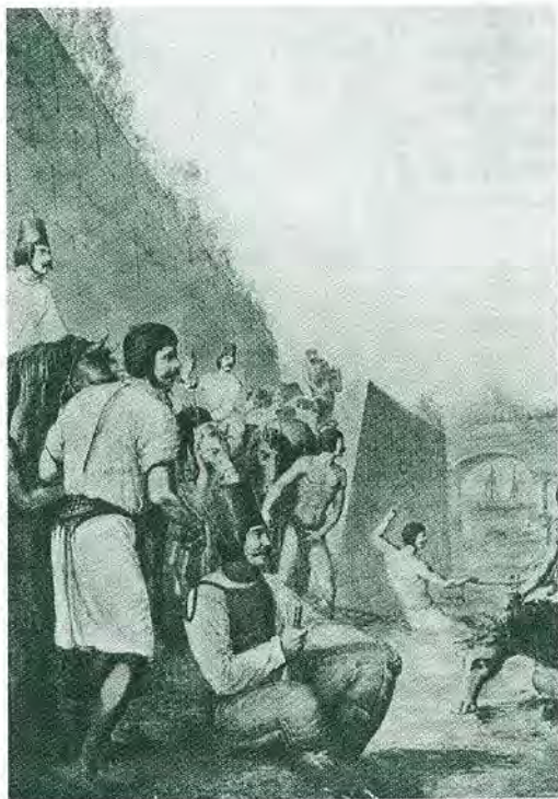
Казачи, купающие лошадей в Сене. С акварели Г. Э. Опича.