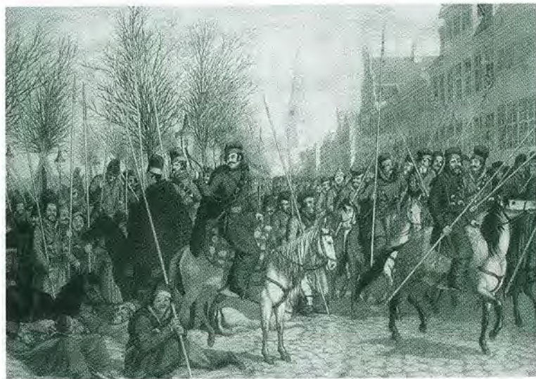
Казачи в Гамбурге 18 марта 1813 года. Раскрашенная гравюра Сура Кристофора. Первая четверть XIX в.