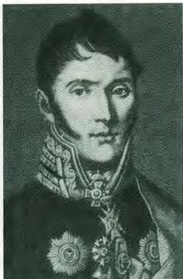
Баронет Яков Васильевич Виллие.