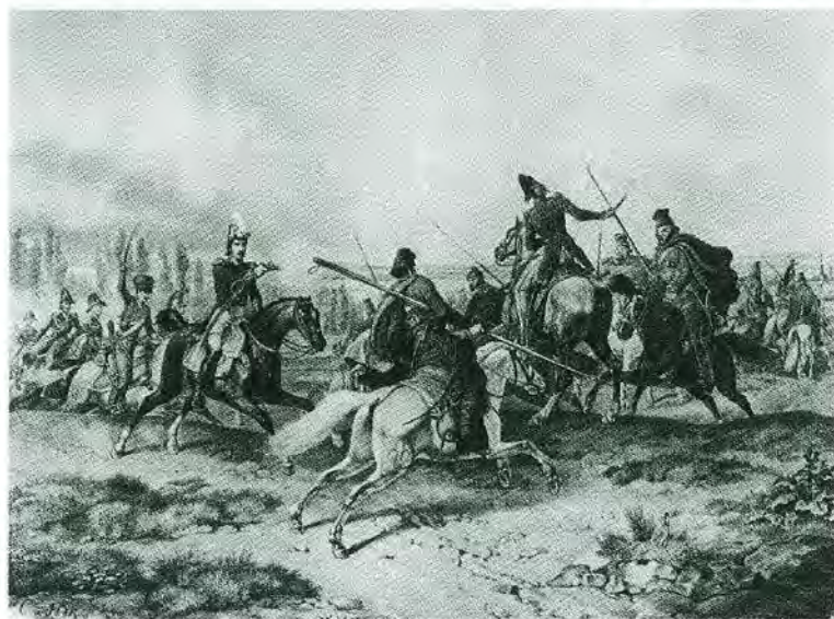
Нападение казаков. А. Адам. 1830-е гг.