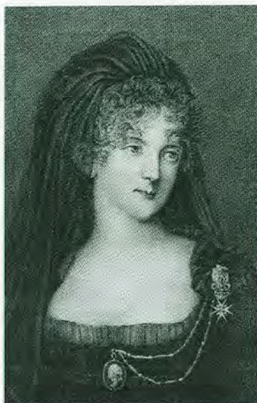
Императрица Мария Федоровна.