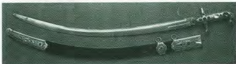
Сабля атамана Платова, пожалованная ему за Персидский поход. 1796 г.