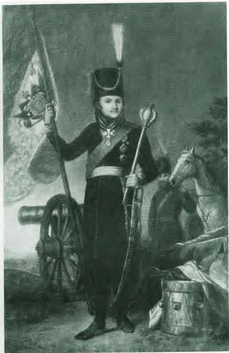
Атаман Матвей Иванович Платов. Неизвестный художник.