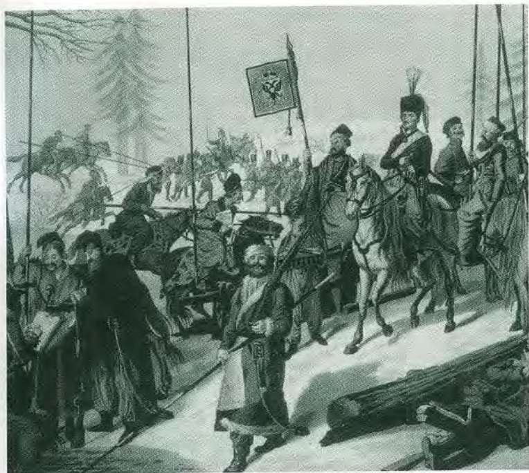
Атаман Платов в сопровождении казаков, калмыков и татар. Раскрашенная гравюра А. Грегориуса по оригиналу Г. Шадова. 1813 г.