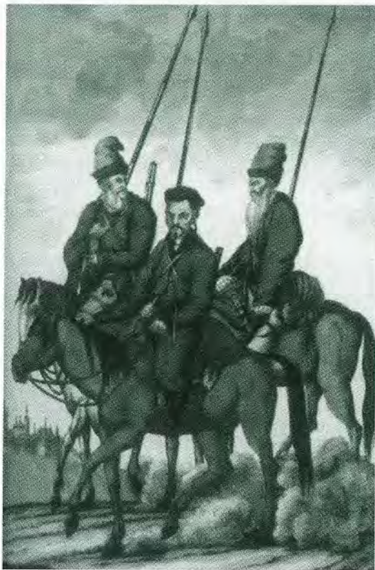
Конные казаки. Гравюра начала XIX в.