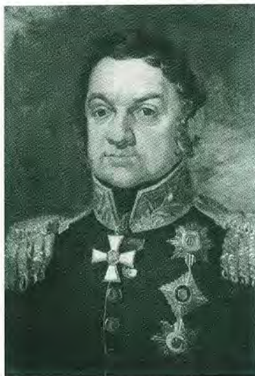
Граф Петр Петрович Коновницын. Дмитрий Сергеевич Дохтуров.