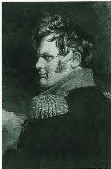
Алексей Петрович Ермолов.