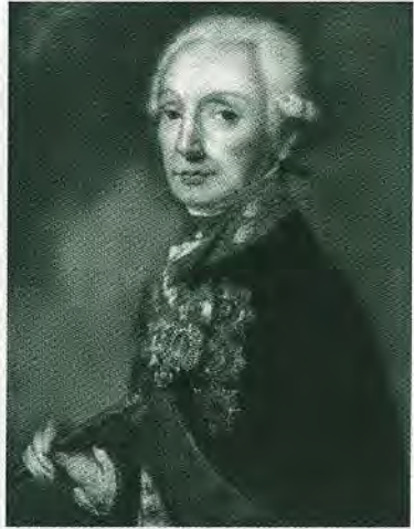
Граф Александр Васильевич Суворов-Рымникский, князь Итальянский.